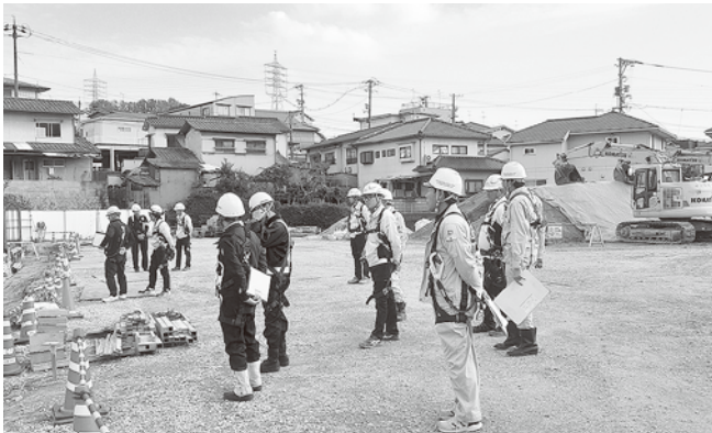
マンション新築工事

【尾道分会】 12月1日、2日の2日間で、尾道労働基準監督署署長、同署安全衛生課長、広島県担当者、建災防安全管理士、安全指導者、視察委員の総勢25名により、5地区7現場で合同パトロールを実施しました。各現場とも安全衛生対策は良好でしたが、注意点として、安全通路の確保、アーク溶接等特化物の管理強化、法肩のロープ等設置、急傾斜地土面の雨対策、斜面昇降路の階段設置、看板増設・誘導員増員等による公衆災害防止対策の強化等を助言して、無事故・無災害で工事を完了できるようお願いしました。