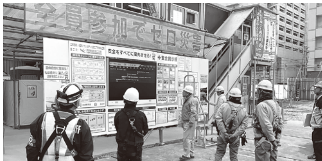
マンション新築工事(東区)

【広島分会】 12月4日に広島中央労働基準監督署より署長をはじめ5名、発注者の広島市担当者、分会役員、安全指導者、安全指導部会員等44名の総勢49名で、広島市東区・西区・中区のマンション新築工事、南区の研究所・大学合築建物新営工事、東広島市のスマートインターチェンジ工事の5現場で合同パトロールを実施しました。各現場とも安全衛生対策は良好でしたが、注意点として、パイプサポートの滑動防止、路ばい線の整理整頓、エレベーター周辺の立入禁止、外部足場のフック付け替え時の設備改善、フルハーネス装着の徹底等の助言をして、無事故・無災害で工期を終えていただくようお願いしました。