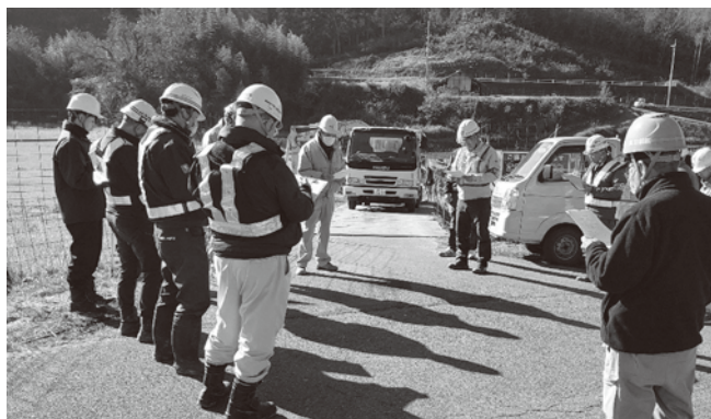
市道災害復旧工事

【廿日市分会】12月3日に廿日市労働基準監督署、広島県、大竹市の職員、建災防関係者の総勢12名で、県道道路改良工事と砂防堰堤工事の2現場で合同パトロールを実施しました。両現場とも安全衛生対策は良好でしたが、注意点として、通学路の学生への安全配慮、看板の設置、斜面凍結等による転落防止措置の徹底等を助言して、最後まで無事故で工事を完遂させてほしいとお願いしました。