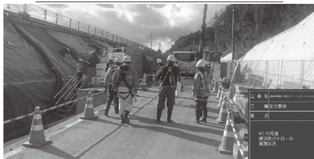
スマートインターチェンジ工事(東広島)

【福山分会】 12月16日に福山労働基準監督署、広島県東部建設事務所、福山市、府中市、建災防役員・安全指導者・安全管理士の総勢29名で、臨床検査センター検査棟新築工事、県道道路改良工事、県道街路工事の3現場の合同パトロールを実施しました。各現場とも安全衛生対策は良好でしたが、注意点として、通路の段差解消の徹底、化学物質搬入後の換気計画の作成、階段足場の手すり等の補強、開口部のカラーコーン表示から単管バリケードへの変更、土壁天端のトラロープ設置状況の改善、高さ1.0m段差の昇降階段の設置、ワイヤロープのほつれ・キックの改善と点検の徹底等を助言して、無事故・無災害で工事を完了できるようお願いしました。