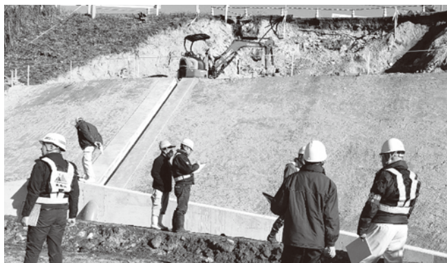
主要地方道道路災害復旧工事