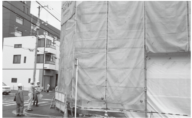
低層住宅新築工事

【三原分会】 12月4日と11日に、三原労働基準監督署、分会役員、安全指導者の総勢14名により、総合病院新棟建設工事、市街地下水道工事、県営住宅外壁修繕工事の3現場の合同パトロールを実施しました。各現場とも安全衛生対策は良好でしたが、注意点として、敷き鉄板の段差解消、スラブ上の足下注意喚起、架空電線の注意喚起、外部足場の巾木脱落箇所の復旧、第三者災害の防止対策徹底等を助言して、無事故・無災害で工事を完了できるようお願いしました。