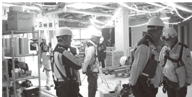
臨床検査センター検査棟新築工事