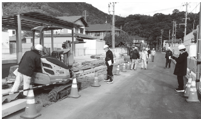
県道道路改良工事

【廿日市分会】12月3日に廿日市労働基準監督署、広島県、大竹市の職員、建災防関係者の総勢12名で、県道道路改良工事と砂防堰堤工事の2現場で合同パトロールを実施しました。両現場とも安全衛生対策は良好でしたが、注意点として、通学路の学生への安全配慮、看板の設置、斜面凍結等による転落防止措置の徹底等を助言して、最後まで無事故で工事を完遂させてほしいとお願いしました。