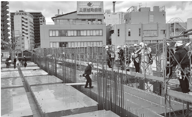
総合病院新棟建設工事

【三原分会】 12月4日と11日に、三原労働基準監督署、分会役員、安全指導者の総勢14名により、総合病院新棟建設工事、市街地下水道工事、県営住宅外壁修繕工事の3現場の合同パトロールを実施しました。各現場とも安全衛生対策は良好でしたが、注意点として、敷き鉄板の段差解消、スラブ上の足下注意喚起、架空電線の注意喚起、外部足場の巾木脱落箇所の復旧、第三者災害の防止対策徹底等を助言して、無事故・無災害で工事を完了できるようお願いしました。