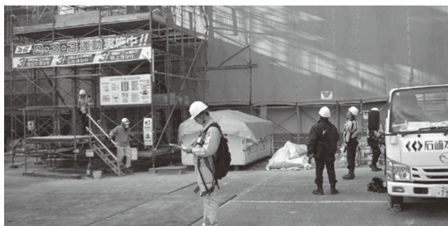
臨床検査センター検査棟新築工事

【福山分会】 12月16日に福山労働基準監督署、広島県東部建設事務所、福山市、府中市、建災防役員・安全指導者・安全管理士の総勢29名で、臨床検査センター検査棟新築工事、県道道路改良工事、県道街路工事の3現場の合同パトロールを実施しました。各現場とも安全衛生対策は良好でしたが、注意点として、通路の段差解消の徹底、化学物質搬入後の換気計画の作成、階段足場の手すり等の補強、開口部のカラーコーン表示から単管バリケードへの変更、土壁天端のトラロープ設置状況の改善、高さ1.0m段差の昇降階段の設置、ワイヤロープのほつれ・キックの改善と点検の徹底等を助言して、無事故・無災害で工事を完了できるようお願いしました。