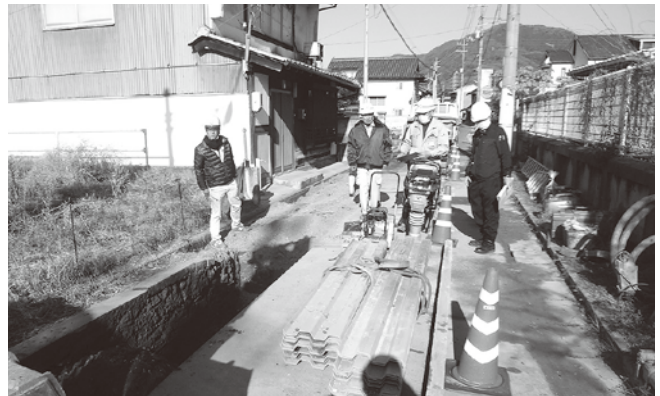
市街地下水道工事

【尾道分会】 12月1日、2日の2日間で、尾道労働基準監督署署長、同署安全衛生課長、広島県担当者、建災防安全管理士、安全指導者、視察委員の総勢25名により、5地区7現場で合同パトロールを実施しました。各現場とも安全衛生対策は良好でしたが、注意点として、安全通路の確保、アーク溶接等特化物の管理強化、法肩のロープ等設置、急傾斜地土面の雨対策、斜面昇降路の階段設置、看板増設・誘導員増員等による公衆災害防止対策の強化等を助言して、無事故・無災害で工事を完了できるようお願いしました。