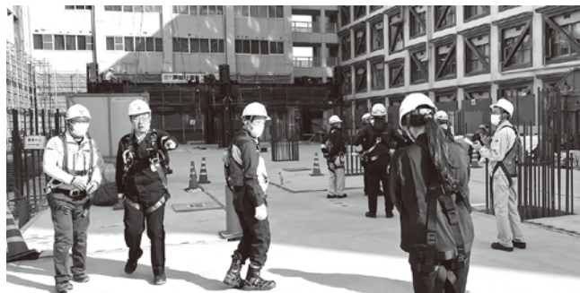
研究所・大学合築建物新営工事(南区)