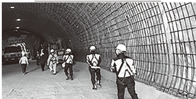
県道道路改良工事