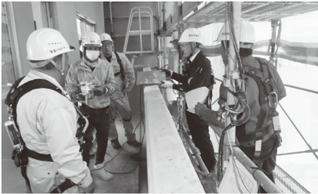
マンション新築工事

【呉分会】 12月17日に呉労働基準監督署長、同署第二方面主任監督官、建災防呉分会役員、安全指導者、木建会員の総勢14名により、マンション新築工事と低層住宅新築工事の2現場の合同パトロールを実施しました。両現場とも安全衛生対策は良好であり、墜落・転落災害の防止対策、第三者災害の防止対策、玉掛作業での合図確認・整理整頓等の更なる徹底と狭隘な場所で施工していることへの注意を喚起して、無事故・無災害にて工事の完成を目指していただきたいと思います。