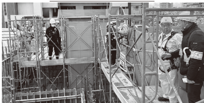
マンション新築工事(中区)