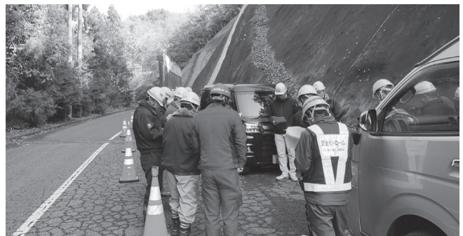
市道災害復旧工事

【廿日市分会】 12月4日に廿日市労働基準監督署、広島県、大竹市の職員、建災防関係者の総勢13名で、岩国・大竹道路高架橋下部工事と配水区雨水管整備工事の2現場で安全パトロールを実施しました。