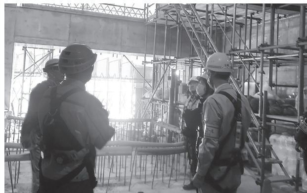
マンション新築工事(西区)

各現場では、責任者より工事概要、作業内容、安全対策等の説明を受けた後、現場内を巡視して墜落・転落防止設備、落下防護設備、足場設備、電気設備、安全通路、掲示物の設置、周辺環境に配慮した安全対策と各作業の実施状況を点検しました。