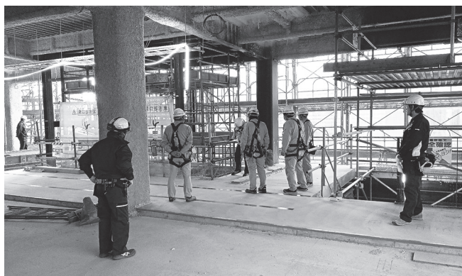
オフィスビル新築工事(南区)

各現場では、責任者より工事概要、作業内容、安全対策等の説明を受けた後、現場内を巡視して墜落・転落防止設備、落下防護設備、足場設備、電気設備、安全通路、掲示物の設置、周辺環境に配慮した安全対策と各作業の実施状況を点検しました。