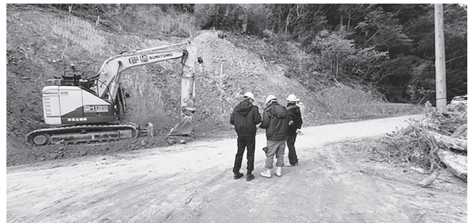
市道道路改良工事

【尾道分会】 12月2、3日の2日間で、尾道労働基準監督署署長、同署安全衛生課長、安全管理士、安全指導者、視察委員の総勢23名により、5地区10現場で合同安全パトロールを実施しました。公共工事ではご担当者様お立会いの下、安全衛生管理状況、作業状況、安全設備等の点検を行いました。