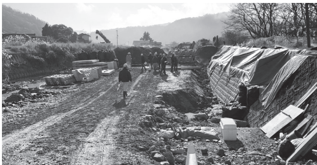
河川浸水被害対策推進工事

両現場とも全体的に整理整頓が充実し、安全管理が適切に行われていました。河川浸水被害対策推進工事の現場では、地山掘削時には地山崩壊に注意し地山点検を常に実施すること、重機作業時に旋回内に立ち入らないように作業従事者へ周知することなどの意見が出されました。市道災害復旧工事の現場では、高所ロープ作業における墜落・転落災害防止のため、メインロープやライフラインロープの点検を常に行うこと、滑落防止のため仮設階段の点検を実施することなどの意見が出されました。また、これから寒くなるので凍結による転倒災害に注意して作業するようお願いしました。