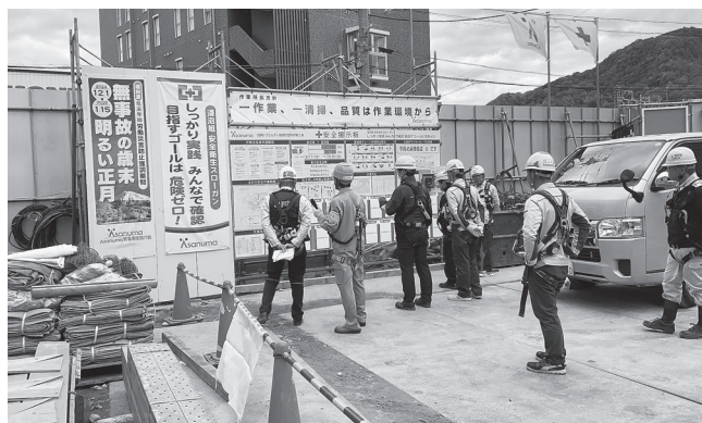
マンション新築工事(安芸郡)

パトロール後の講評では、いずれの現場も場内の整理整頓が行き届いており、安全通路及び照度の確保、段差の解消等の転倒災害防止対策の徹底、脚立やはしご道使用時の注意点の掲示など安全管理の工夫が見られ、良好な取組が実施されていました。