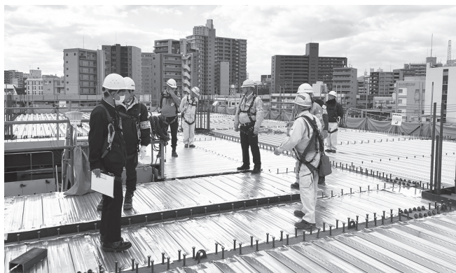
オフィスビル新築工事(東区)

【広島分会】 12月4日に広島中央労働基準監督署より和崎署長をはじめ5名、発注者の広島市担当者、分会役員、安全指導者、安全指導部会員、一般会員の36名、総勢41名で、広島市東区・南区のオフィスビル新築工事、西区・安芸郡のマンション新築工事、中区の市街地再開発事業の建築5現場で合同安全パトロールを実施しました。