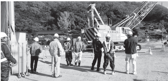
県道道路改良工事

各現場では、責任者より工事概要等の説明を受けた後、現場内を点検しました。講評では、各現場の管理体制は良好で、墜落転落、転倒災害の防止、重機の転倒防止、第三者災害対策の強化、切土法面の浮石の注意喚起等を徹底して、無事故・無災害で工事を完了できるようお願いしました。