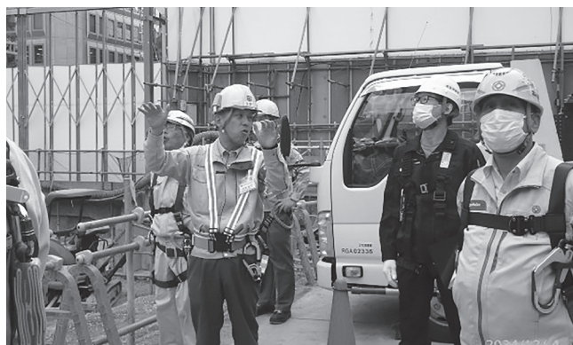
市街地再開発事業(中区)