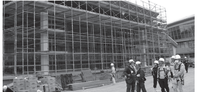
屋内プール増設工事

【三原分会】 12月5日と11日に、三原労働基準監督署、安全管理士、分会役員、安全指導者の総勢9名により、一般県道道路改良工事、下水道(面整備)工事、市道道路防災工事の3現場の合同安全パトロールを実施しました。