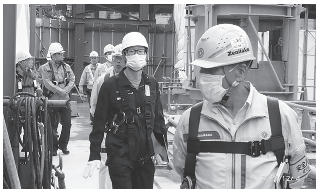
市街地再開発事業(中区)

今後、寒冷下の作業に伴う火気管理や年末年始で工事の輻輳化から生じる労働災害に留意して、無事故・無災害で工期を終えていただくようお願いしました。