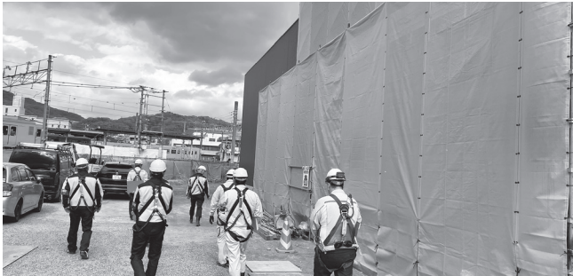
市民プール整備事業

パトロール後の講評として、市民プール整備事業現場は、整理整頓が適切で電気回路先の明示、足場・機械の点検簿の明示等日常点検を徹底されていました。屋内プール増設工事現場では、第三者災害防止に努められ、作業工程、作業手順の確認を毎日行って、ゼロ災活動を遂行されていました。また、各工区の安全通路の確保と識別が一目でわかるようにされる等安全意識が高いと感じる現場もありました。引き続き墜落・転落災害の防止、転倒災害の防止に努めて頂いて、無事故・無災害で工事を完了できるようお願いしました。