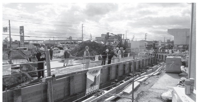
配水区雨水管整備工事